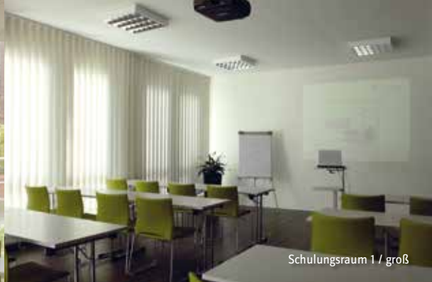
Schulungsraum 1 / groß