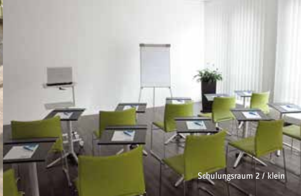
Schulungsraum 2 / klein