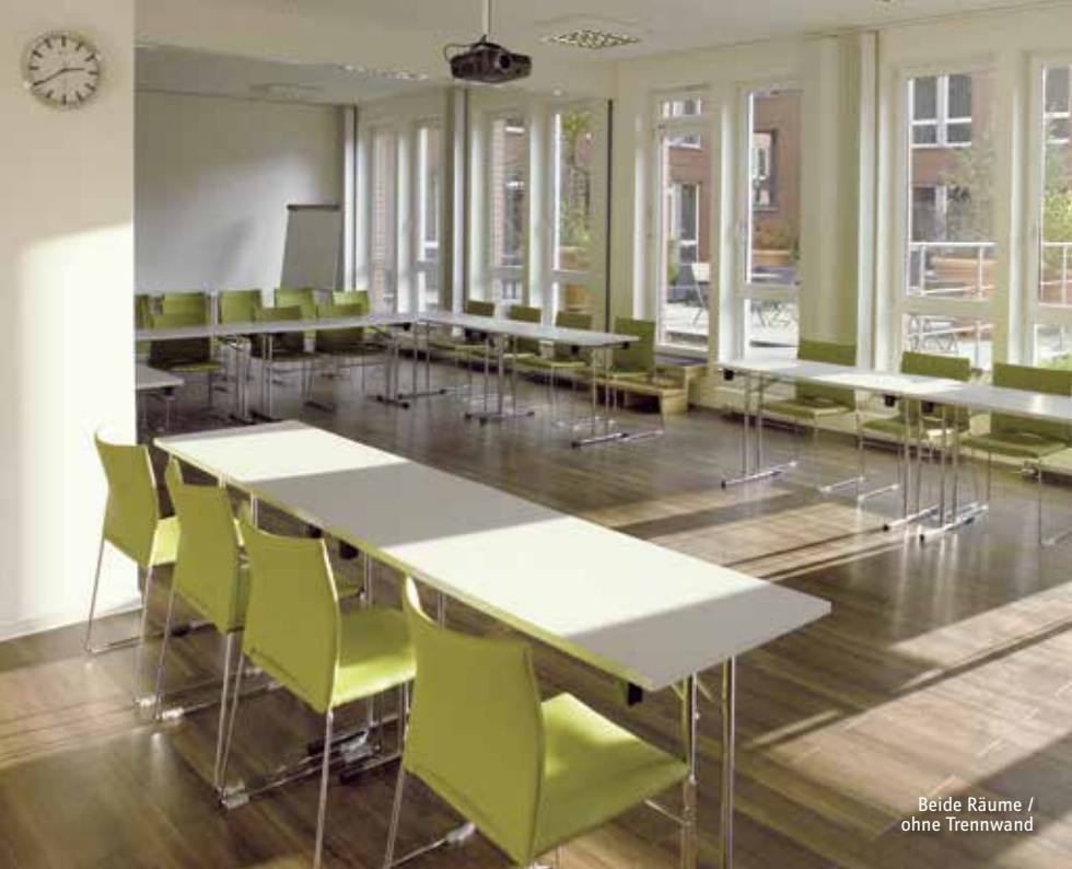
Beide Räume / ohne Trennwand