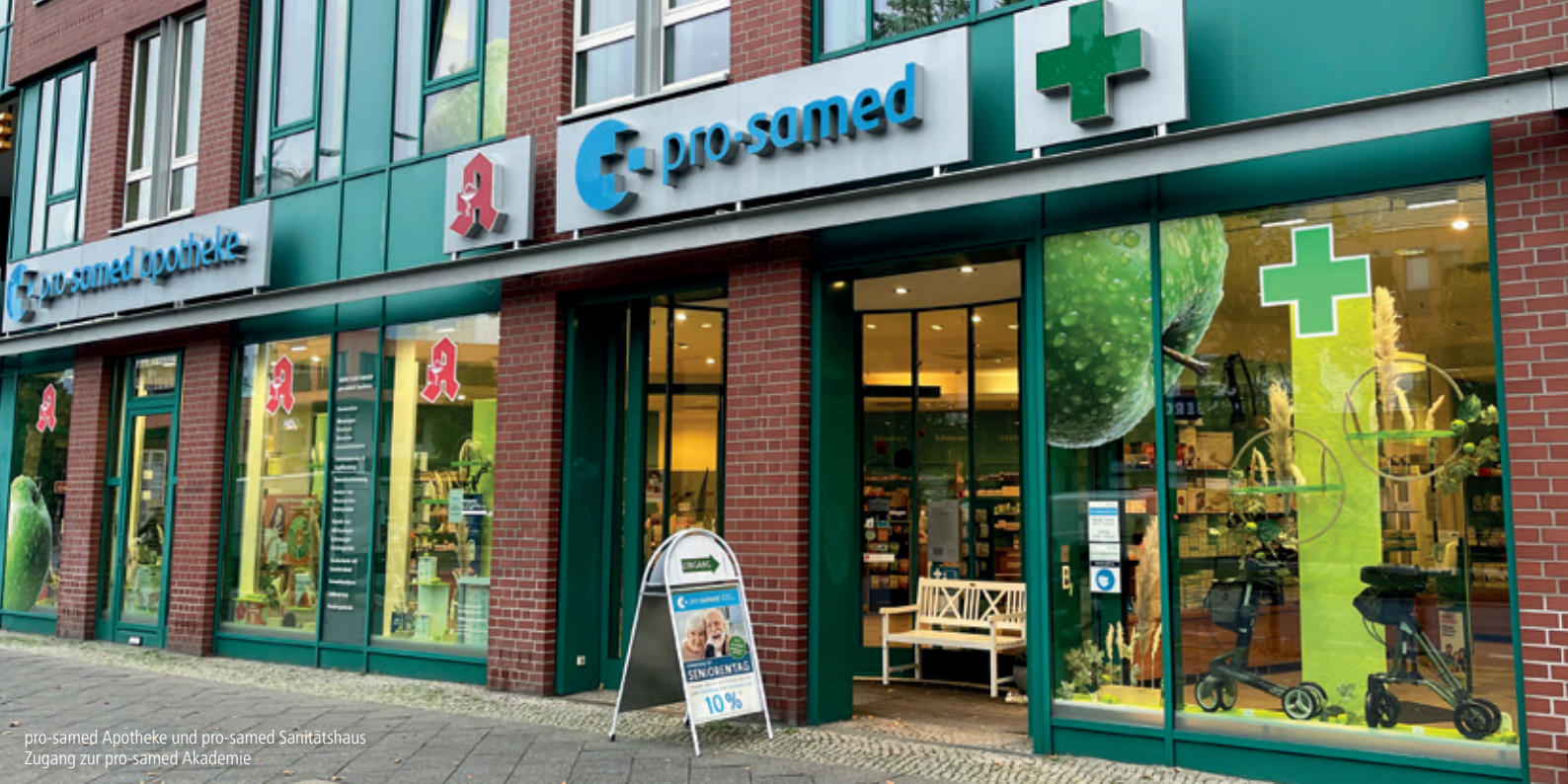
pro-samed Apotheke und pro-samed Sanitätshaus Zugang zur pro-samed Akademie