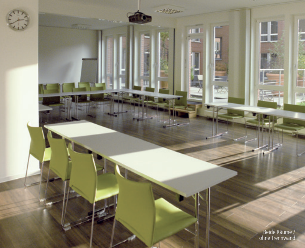
Beide Räume / ohne Trennwand