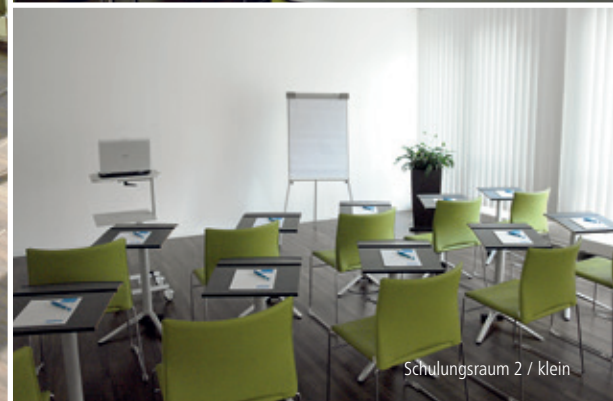
Schulungsraum 2 / klein