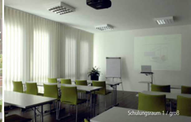
Schulungsraum 1 / groß